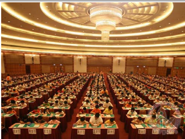
國際展覽中心六樓展覽廳 3 九龍灣展覽徑一號